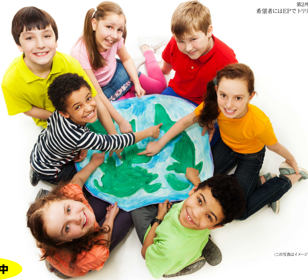
(この写真はイメージです)